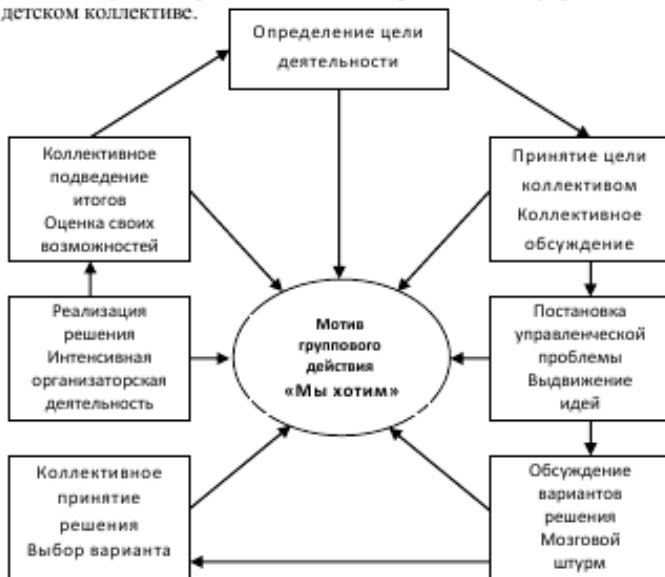
Рис. 1. Модель развития самоуправления в коллективе